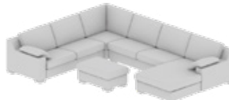
Wohnlandschaft Living space