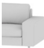
Typ 2 / Type 2