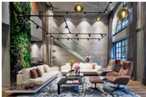
JAB ANSTOETZ Group Unterer Anger 3 • 80331 München