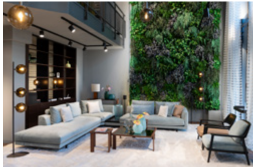
JAB ANSTOETZ Group Knesebeckstraße 61 • 10719 Berlin