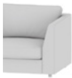
Typ 3 / Type 3