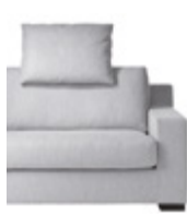
Integrierte Nackenstütze Integrated neckrest