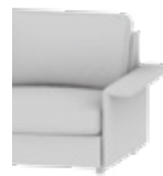
Typ 9 / Type 9