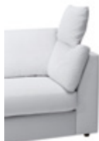
Integrierte Kopfstütze Integrated headrest