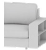
Armlehnenregal Armrest shelf