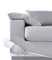
Abnehmbare Bezüge Removable covers