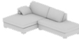
Longchair-Kombination Longchair combination