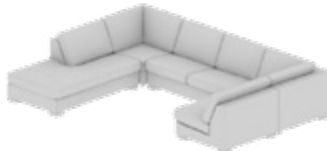
Wohnlandschaft Living space