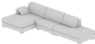
Longchair-Kombination Longchair combination