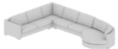
Wohnlandschaft Living space