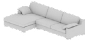
Longchair-Kombination Longchair combination