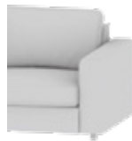
Typ 7 / Type 7