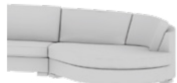
Anbauelement Extension element