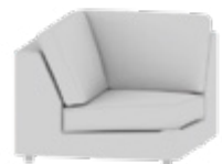
Eckelement Corner element