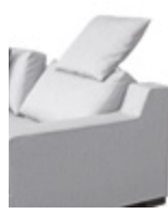
Rückenverstellung Longchair Adjustable longchair back