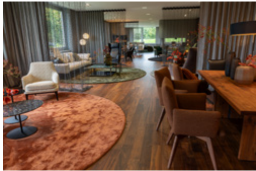
BW Bielefelder Werkstätten Potsdamer Straße 180 • 33719 Bielefeld