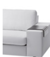
Ablagematte Rollable wooden storage tray