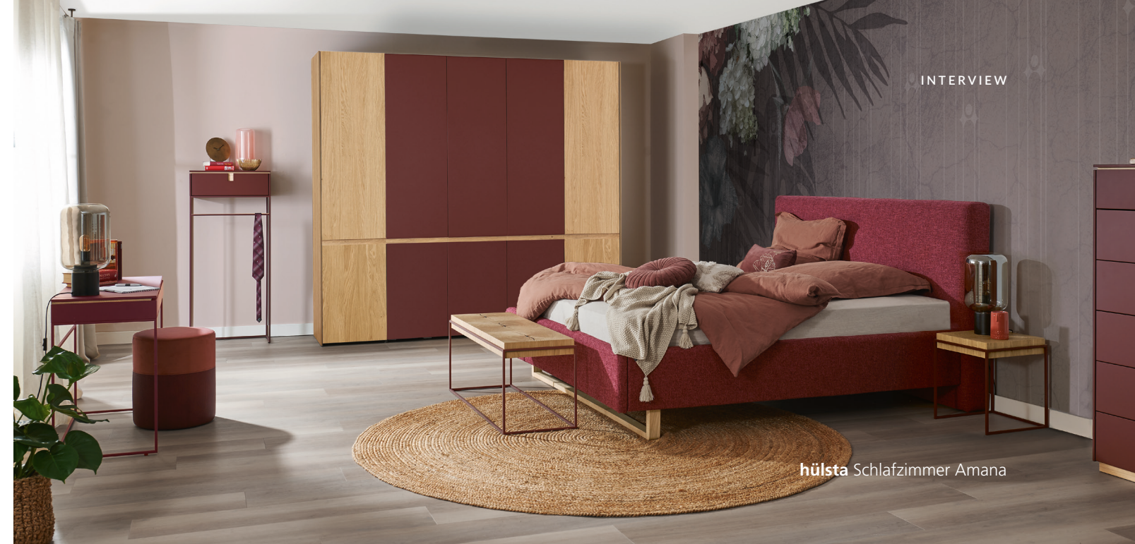
hülsta Schlafzimmer Amana

Möbel klimaschonend zu fertigen, ist ein Prozess, an dem man kontinuierlich arbeiten muss. Das tun wir – und zwar schon sehr lange. hülsta fertigt seit der Gründung des Unternehmens vor mehr als 80 Jahren im Münsterland. Unsere Möbel sind dabei kein „Fast furniture“: Wir wissen aus Gesprächen mit unseren Kundinnen und Kunden, dass die Möbel viele Jahre, oft Jahrzehnte ein fester Bestandteil des Zuhauses sind. Dank zeitlosem Design und solider Qualität ziehen sie immer wieder um – sei es in neue Wohnungen oder neue Zimmer. Der Satz „Nichts ist nachhaltiger als ein langlebiges Möbel“ trifft deshalb auf hülsta Möbel voll und ganz zu und ist ein wichtiger Aspekt, wenn man über Klimaschutz spricht. Uns ist es außerdem wichtig, dass Hölzer zertifiziert sind.