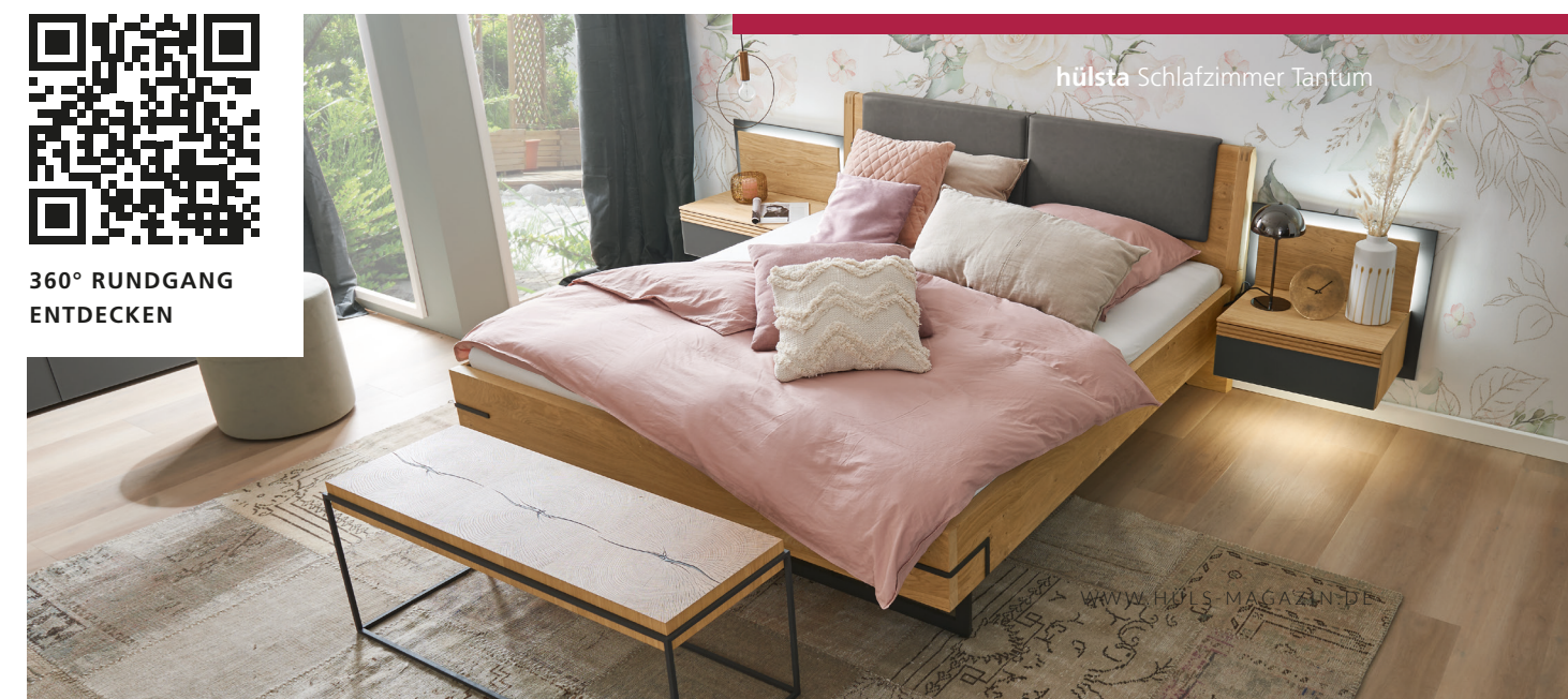
hülsta Schlafzimmer Tantom