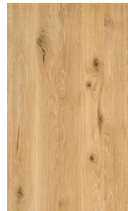
Eiche Wild Weißöl*